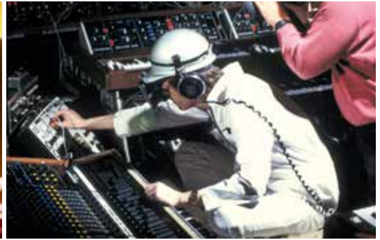
Ars Electronica 1980 – Klaus Schulze: Linzer Stahlsinfonie