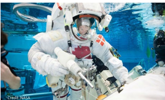
↑ ESA-Astronaut Andreas Mogensen beim Training für Weltraumspaziergänge im Neutral Buoyancy Laboratory der NASA in

Astronaut*innen müssen im Rahmen ihrer Missionen viele Objekte und Geräte zusammenbauen. Ein Teil davon sind kleine Objekte, die die Astronaut*innen während ihres Aufenthalts auf der Internationalen Raumstation (ISS) handhaben müssen. Manchmal müssen die Astronaut*innen Weltraumspaziergänge, sogenannte Extravehicular Activities (EVAs), unternehmen, um diese Aufgaben außerhalb der ISS zu erledigen. EVAs werden auf der ISS durchgeführt, um die Montage und Wartung fortzusetzen und die ISS wiederherzustellen und aufzurüsten.