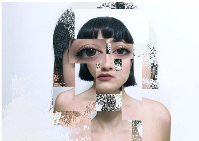
„Portrait of a Generative Memory“ © Indiara de Benedetto

Das Unbekannte, das Ungezähmte, das Widerstandsfähige, das Zufällige, das Laute und das Umherschweifende finden an fünf Tagen (9. bis 13. September) Raum in der Innenstadt. Im Fokus: die Arbeiten junger Künstler*innen, sie haben den Ruf, besonders widerstandsfähig zu sein. Aufgeben ist für sie, selbst in Zeiten einer Pandemie, keine Option. Wie in einem Ökosystem haben sie sich an härteste Bedingungen angepasst und nach neuen Wegen gesucht, die Resultate dieses Prozesses sind nun zu sehen.